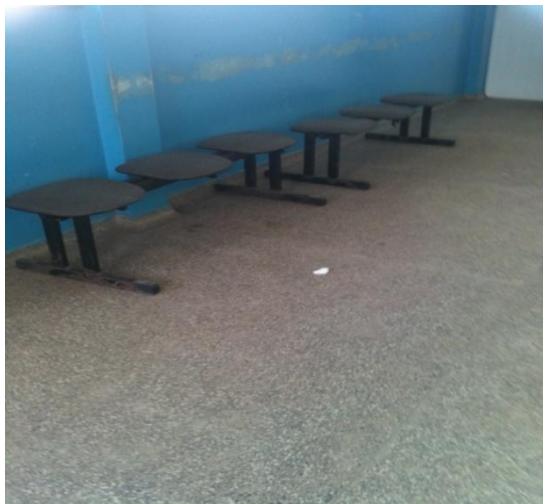
Figura 5 – Sala de espera para o atendimento de uma Unidade da ESF – Boa Vista/RR

O forro de uma das unidades básicas caiu, quase ferindo um funcionário que estava no local. Em época de chuva as salas ficam alagadas, devido ao grande número de telhas avariadas.