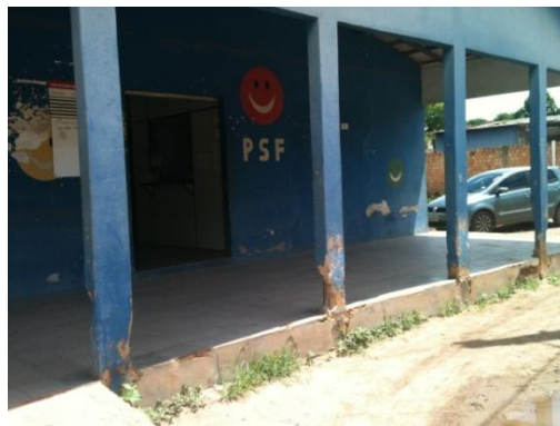
Figura 2 – Fachada de uma das Unidades da ESF visitadas em Boa Vista/RR

A foto da figura 3 foi tirada na sala de curativos de uma das unidades visitadas. A cama que deveria ser utilizada para coleta de exames, realização de curativos, serve