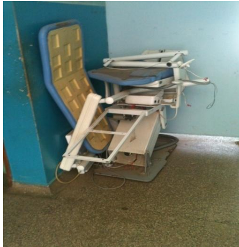
Figura 1 – Equipamento sucateado de uma unidade da ESF - Boa Vista/Roraima.

Na fig. 2 pode-se observar que as vigas de sustentação, do vão de entrada da unidade estão totalmente avariadas com as ferragens estão expostas. O prédio alugado está em situação muito precária, colocando em risco os profissionais e população que lá transitam diariamente.