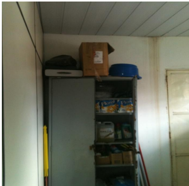
Figura 7 – Local de guarda de material de limpeza de uma Unidade da ESF- Boa Vista/RR

Questionados sobre a disponibilidade de material para a realização das atividades da equipe, 69% responderam que não dispõem de material e 21% que sim, que a equipe tem material necessário. Entre os materiais que mais faltam estão: teste de glicose (que em algumas unidades falta a mais ou menos um ano), material para curativos, material para coleta de preventivo, medicamentos, material de expediente, tinta para impressora, etc.