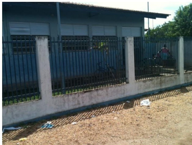
Figura 4 – Fachada de uma Unidades da ESF –Boa Vista/RR

Na figura 4 apresentamos uma das fachadas observadas. A pintura está deteriorada, lixo espalhado, grades danificadas, etc. é o retrato do descaso da administração municipal com suas unidades de saúde.