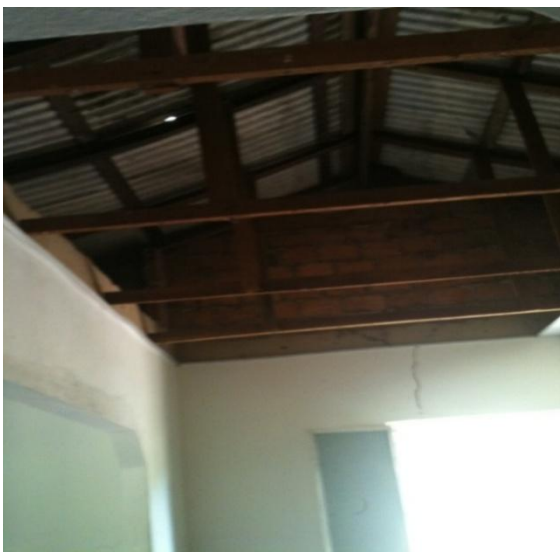
Figura 6 – Teto de uma Unidade da ESF – Boa Vista/RR

O forro de uma das unidades básicas caiu, quase ferindo um funcionário que estava no local. Em época de chuva as salas ficam alagadas, devido ao grande número de telhas avariadas.