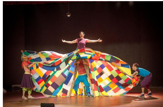
Interação e brincadeiras levam as crianças ao mundo da criatividade