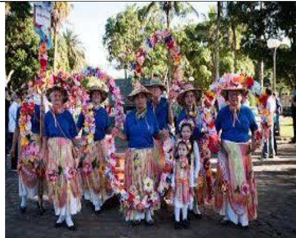
Boi de Norte e Boi Barroso se apresentaram na Praça Feira Mar