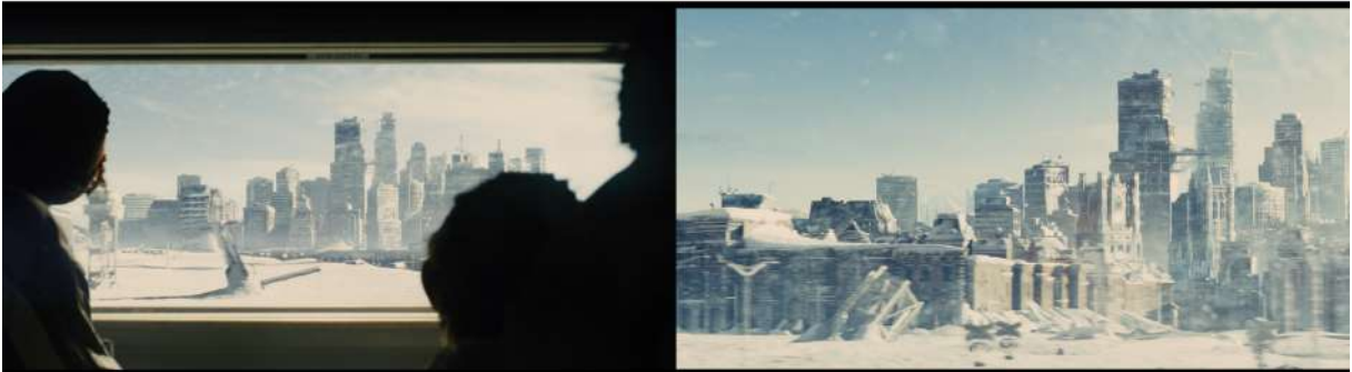
Figura 6 - Planeta terra congelado visto de dentro do trem em Expresso do Amanhã

que fica rodando todo o planeta sem jamais parar, sendo estes os últimos sobreviventes da humanidade.