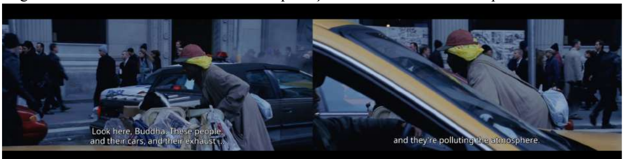
Figura 4 - Morador de rua reclamando da poluição dos carros em O dia depois de amanhã

Pudemos ver também um morador de rua passar com seu cachorro reclamando da quantidade de carros e de como eles poluem a atmosfera (Figura 4), mostrando como mais agressiva para vítimas de capitalismo uma situação dessa pode ser.