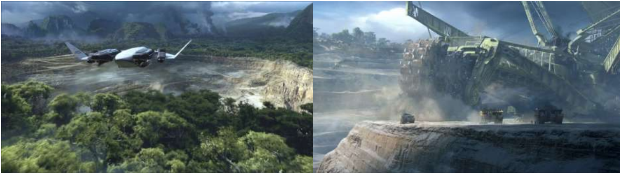
Figura 1 - Destruição do solo de Pandora em Avatar