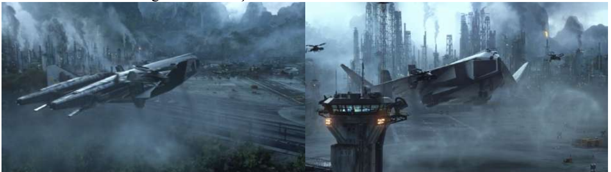
Figura 2 - Poluição na atmosfera de Pandora em Avatar

Além disso é possível perceber também a massiva quantidade de poluição na atmosfera produzida no lugar onde os “terráqueos” estão instalados em Pandora, através de combustão, principalmente, evidente pelas enormes chaminés industriais por todo o lugar (Figura 2). Remetendo aos gases emitidos pelas grandes indústrias, como os do efeito estufa, que acabam agravando as mudanças climáticas e o aquecimento global, resultando na crise climática.