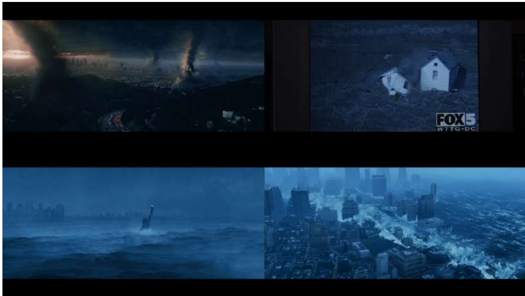
Figura 5 - Eventos climáticos extremos em O dia depois de amanhã