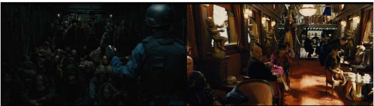
Figura 7 - Contraste entre os habitantes da cauda e os da frente do trem em Expresso do Amanhã

Depois dessa contextualização, a narrativa principal se inicia, situando-se 17 anos depois do acontecimento descrito acima. Os sobreviventes vivem nesse trem em uma enorme, mas não chocante, desigualdade social. A população mais pobre vive nos vagões dos fundos, na cauda do trem, às margens, enquanto os ricos vivem nos vagões da frente (Figura 7). A classe pobre fornece serviços e tudo mais para o lazer e bem-estar dos mais ricos.