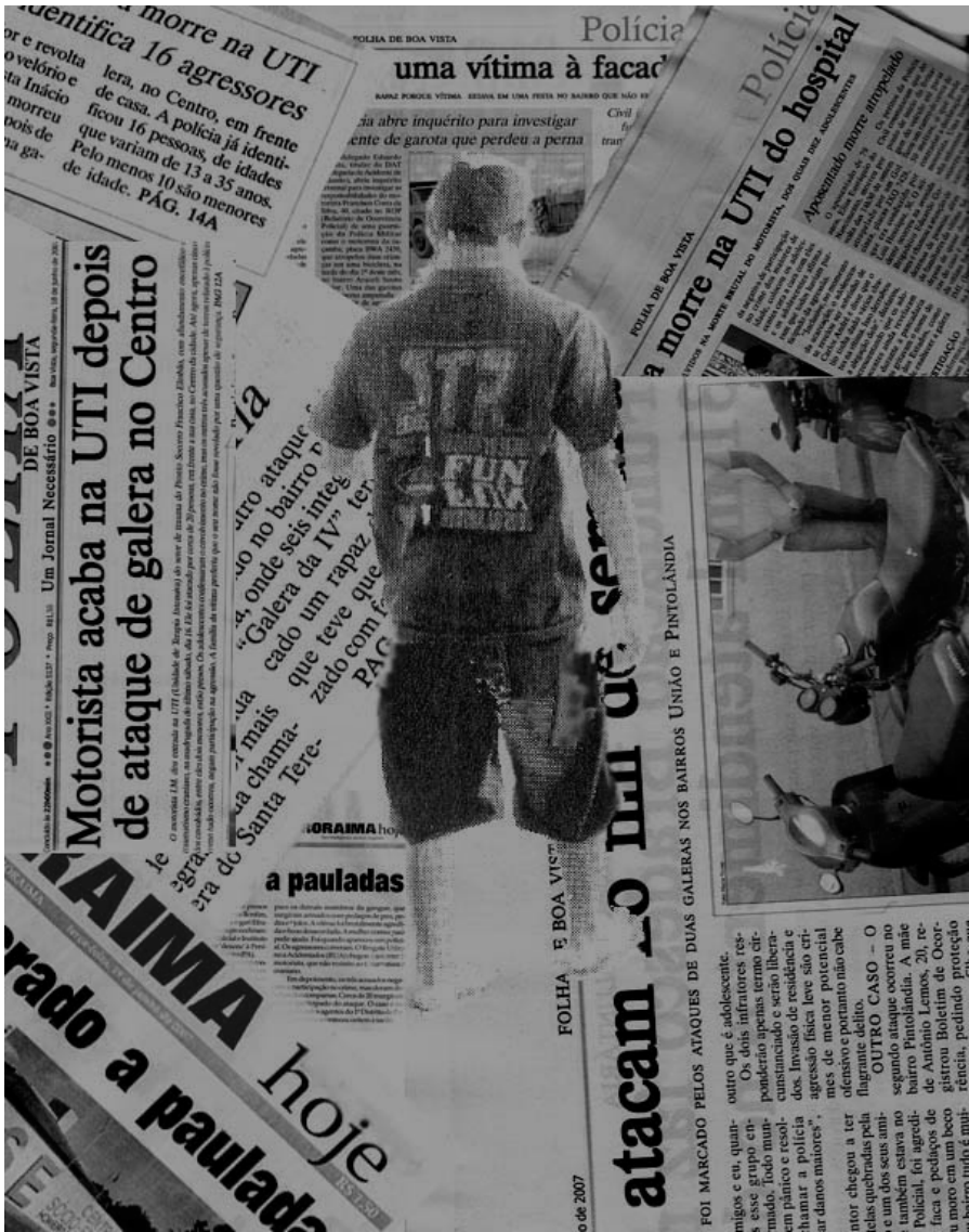
Matérias ligadas a ataques de galeras