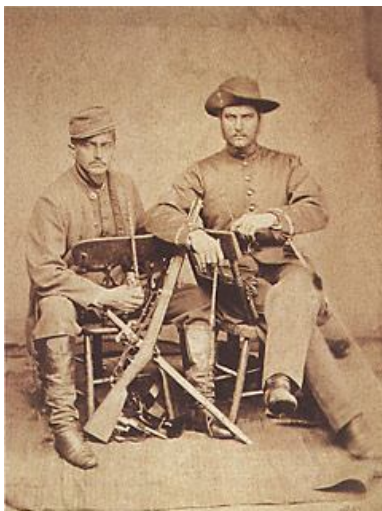
Oficiais brasileiros da Guerra do Paraguai (1868).